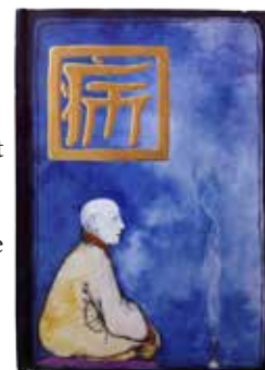
Első könyve: Qi avagy az életerő megőrzésének ősi kínai módjai

– Ugyan lehet kezelni akupunktúrával és homeopátiával is lelki betegségeket, az a jó, ha egy betegségre több oldalról is hatunk. A pszichodráma voltaképp színház, jeleneteket