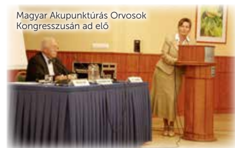
Magyar Akupunktúrázó Orvosok Kongresszusán ad elő

ként dolgozhattam. Később megbízták, hogy hozzak létre egy osztályt, ahol már 5 akupunktúrázó orvos dolgozott asszisztensekkel, valamint gyógytornász, fizioterápiás, masszőr, egy nagy csapat. 2005-ig dolgoztam ott. Ez az osztály Európában egyedülálló volt és rengeteg beteg fordult hozzánk.